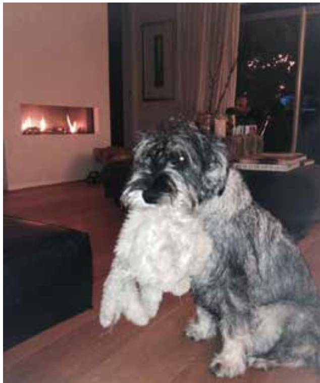
Olmo met zijn knuffel, het blijft erg grappig uitzien