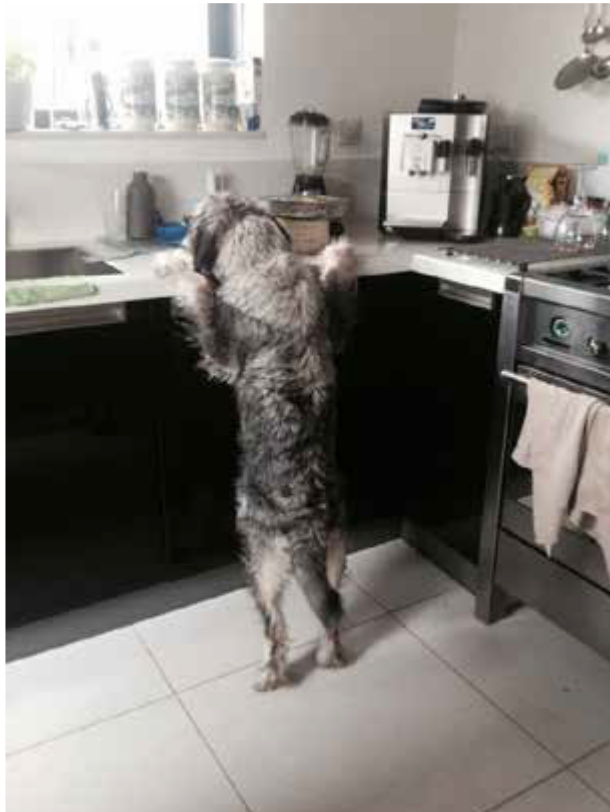
Ondeugend is hij ook. De keuken is erg interessant en omdat hij nu wat groter is kan hij dus ook een kijkje nemen op het aanrecht